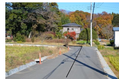
④突き当りを左にお進みください。