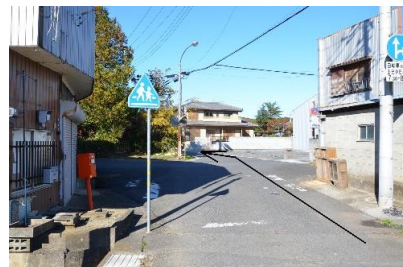
③交差点を直進してください。