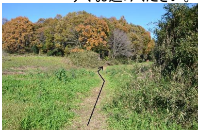
⑨牧草地にでます。道なりにお進みください。