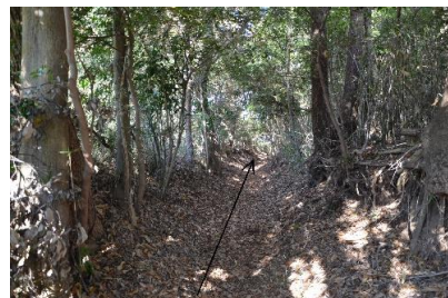
⑪道なりにお進みください。