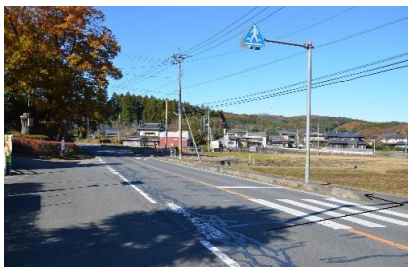
①少年自然の家の前の横断歩道を渡り, 左にお進みください。

森林公園(水戸デジタルテレビ送信所のある駐車場)まで片道1.6km, 約30分のハイキング。田園風景を見ながら森の入り口まで進み, 静寂な空気の森を抜けると, 森林公園に到着します。森林公園には, 森の四季が楽しめるハイキングコースや, やぎと触れ合うことのできるふれあい牧場, 古生代末期の原始恐竜から新生代のマンモスまで実物大の恐竜模型が14体ある恐竜広場, 各種遊具, トレイルランニングコースなど大自然の中で思いっきり楽しむことができます。