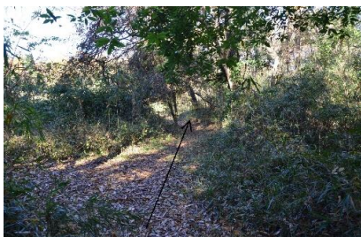
⑧途中合流する道がありますが, まっすぐお進みください。