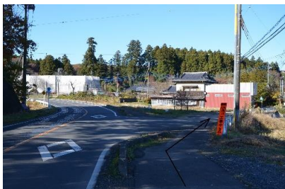
②ふたまたに分かれるところを右にお進みください。