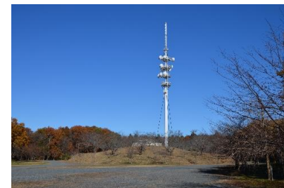
⑫森林公園内の水戸デジタルテレビ送信所のある駐車場に出ます。