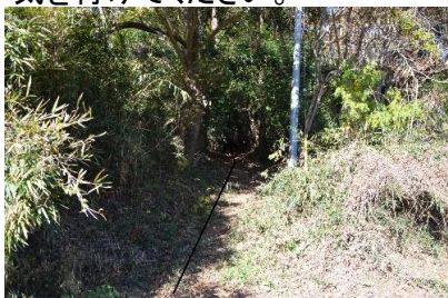
⑩再び森の中に入ります。