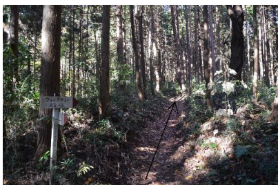
⑦道なりにお進みください。森の中は滑りやすいので, 十分に気を付けてください。