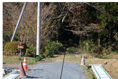
⑥森の入り口まで来たら, そのまま森の中にお進みください。